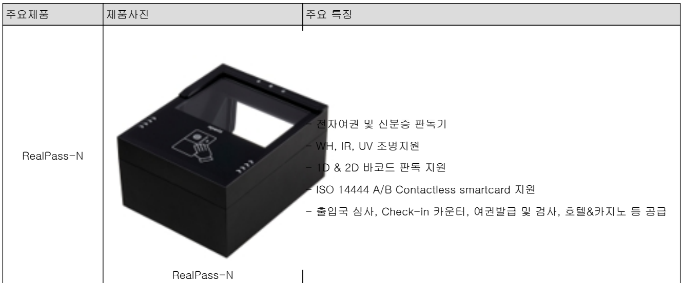
[당사 eDocument 디바이스 제품]

지문 인증을 활용한 카드 발급 등 복합 업무를 단일 장치에서 지원하는 장점을 가지고 있어 은행권에서 선호하는 제품 중의 하나입니다. 인도 국방부, 이란 은행 등 사용처에서 전자신분증 판독과 지문 인식을 동시에 수행하는 사업에 적용되고 있습니다.