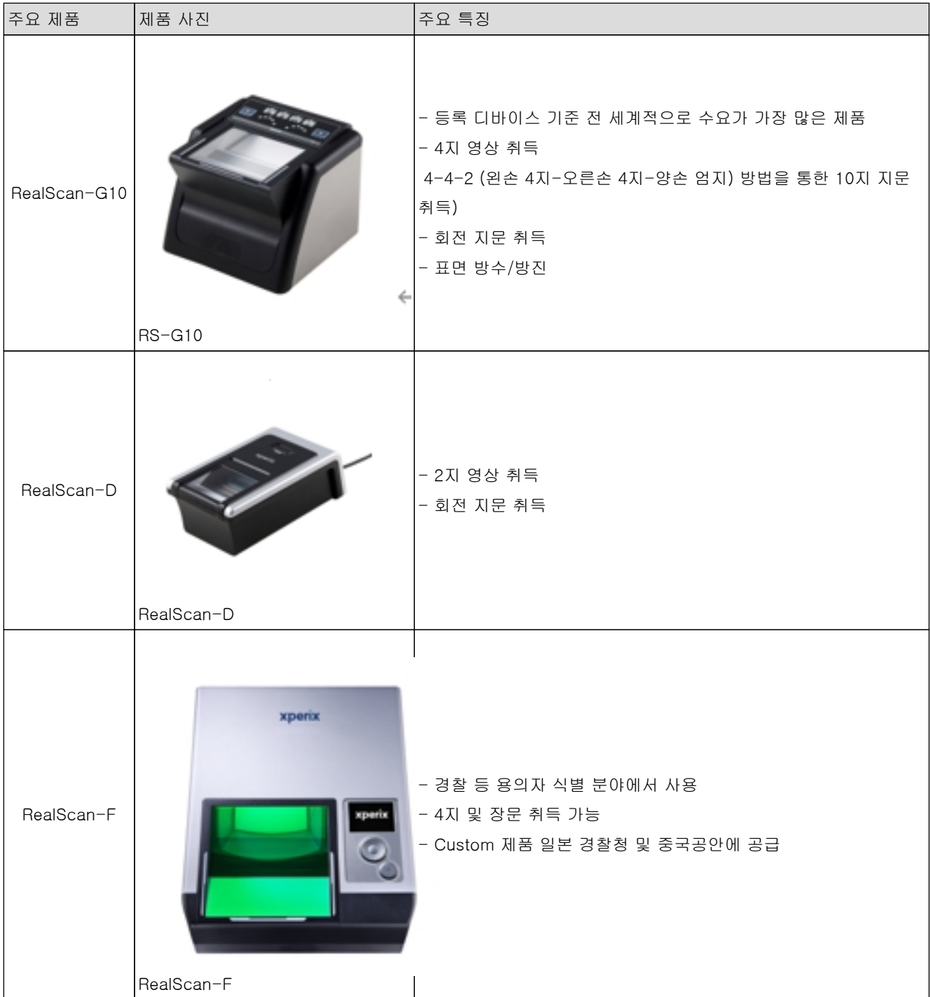
[당사 등록 디바이스 제품]

2021년 하반기 초슬림 및 경량 FAP 60 지문등록 솔루션인 RealScan S60은 TFT기술과 당사의 광학기술이 결합되었으며 A.I. 딥러닝 기술이 적용된 위조지문 감지 알고리즘 적용으로 한층 뛰어난 성능을 보이고 있습니다.